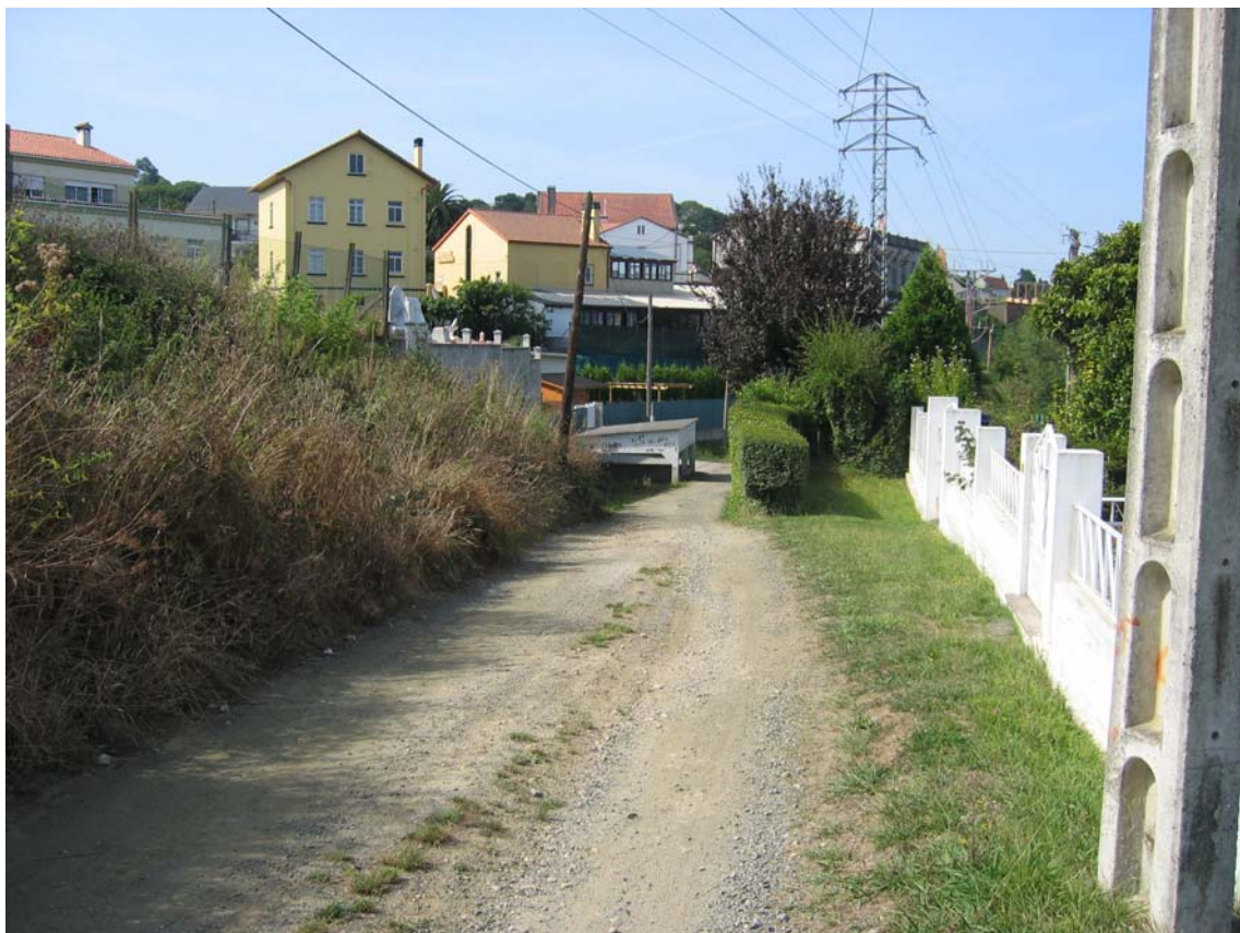
F2.- Vista central do C. Tras do Río amosando o desnivel existente parcelas da esquerda e rasante, co lavadeiro ao fondo en situación de fóra de ordenación.